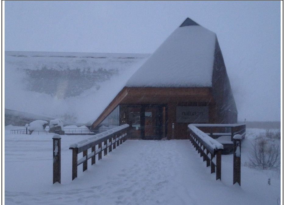
Naturum Tåkern i snöoväder