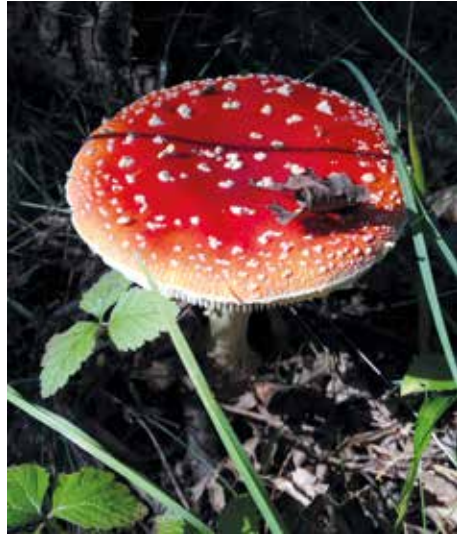
Röd-flugsvamp är inne tidig.

Pris: 50 kr/vuxen. Arr: Mjölby kommun. Samling vid parkeringen vid Klämmestorpskolan i Mantorp.