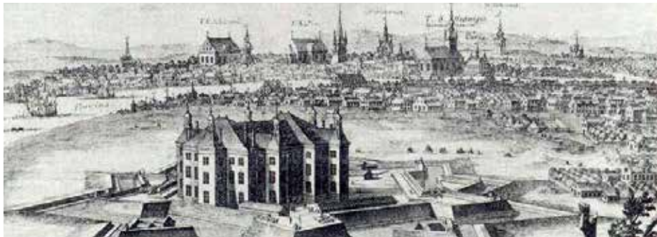
Johannisborg 1600-talet.

Vägbeskrivning: Från Kuddby kyrka kör mot Ö Ny 4 km. Parkering: På höger sida.