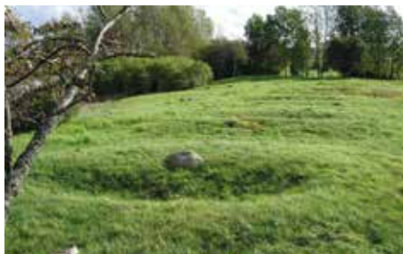
Bergsätterna i Kuddby.

Vägbeskrivning: Kör Norra Promenaden österut, tag vänster efter postterminalen och höger mot portornet. Parkering: På vänster sida mitt emot tornet.