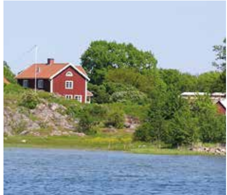
Boköisudden Fångö

Återigen välkomnas alla besökare till en traditionsenlig Boködag och ta del av många av de höga natur- och kulturmiljövärden som är utmärkande för den Östgötska skärgården. Arrangerad transport kommer att finnas till ön samt guidningar och andra evenemang under dagen. Pris: Vuxen 100 kr, barn 6-12 år 50 kr, barn 0-6 år gratis. Arr: Länsstyrelsen och Boköbor. Förbokning av båtresa krävs och görs till Valdemarsviks turistbyrå tel 0123-122 00. Information om tider för transporter samt dagens innehåll kommer i lokalpressen samt på turistbyrån i Valdemarsvik.