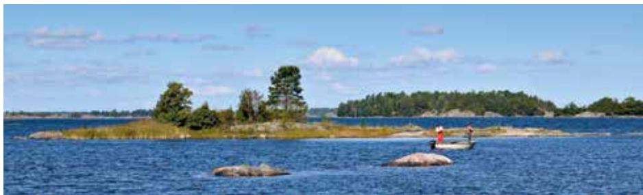
S:t Anna skärgård.