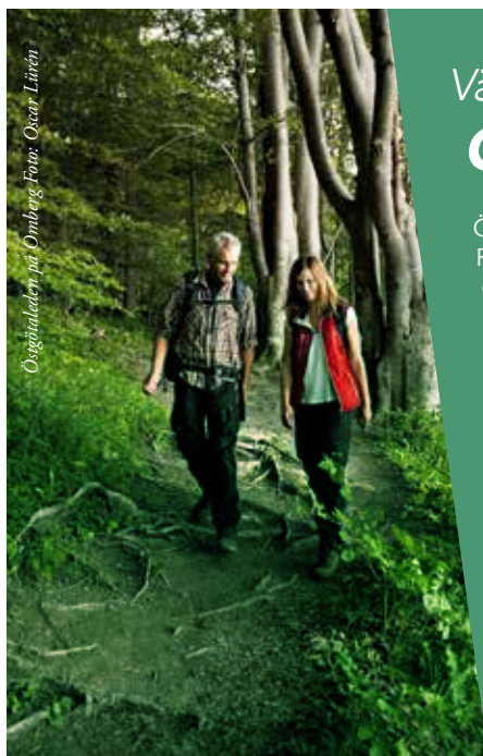
Östgötaleden på Örnberg.

Välkommen att ta del av Östergötlands natur