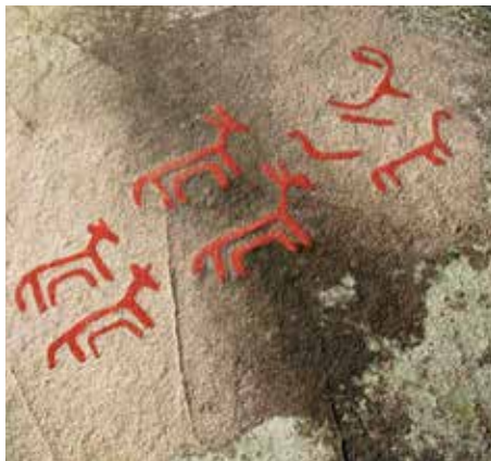
Bronsåldersristning i Hästholmen.