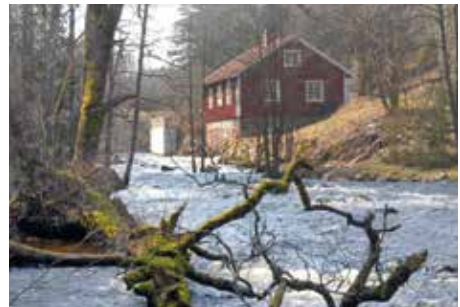
Bruksmiljö vid Bulsjöån